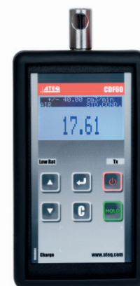
CDF 60 Calibrateur de fuite