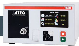
F620 Boitier Compact