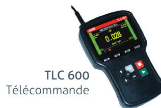
TLC 600 Télécommande