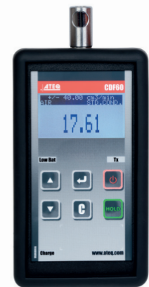
CDF 60 Calibrador de flujo de fugas